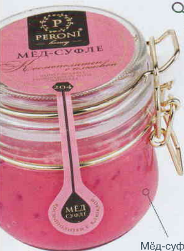
Мёд-суфле Peroni Honey @peroni_club